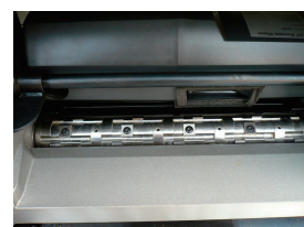
ヘリカルカッター